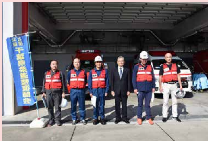
〔訓練に参加する南総支部会員〕

令和4年10月23日（日）本会が公益事業として毎年参加している九都県市（埼玉県・千葉県・東京都・神奈川県・横浜市・川崎市・さいたま市・相模原市・千葉市）合同防災訓練が、千葉県会場として大網白里市の3会場において開催されました。本訓練は、県や市、各防災機関が連携した救助訓練や、自主防災組織を中心とした避難所などの実践的な訓練のほか、減災への備えや発災時の心得などを啓発する場を設け、自助・共助・公助の相互の繋がりを強化し、地域の防災力を向上することを目的として開催されます。今年度は本会山岡副会長が来賓で出席、南総支部会員5名が、医師・看護師・DMATと協力し救護所に搬送されてきた、トリアージ後の中等症・軽傷の負傷者に対し日ごろの業務を生かし適切かつ迅速に応急救護に対応しました。