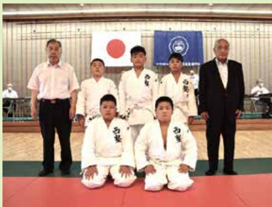
日整全国大会 千葉県代表選手