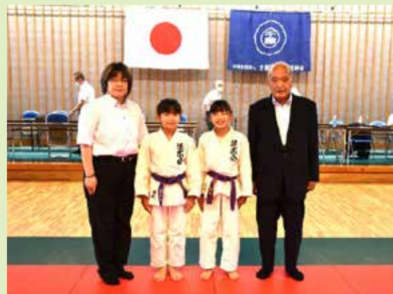
日整全国形競技 千葉県代表選手